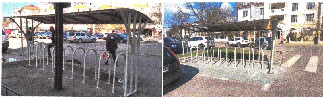
Rastele – Iasi, Hala Centrala